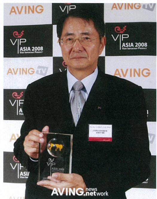
（写真の説明：スターマックスインターナショナルの金政官代表）