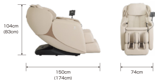
( ) 内の数字は背もたれを倒した状態の寸法