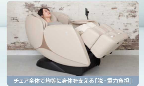
チェア全体で均等に身体を支える「脱・重力負担」

独自の研究により、「脱・重力負担」のゼログラビティ角度に着目。チェア全体で均等に身体を支え、全身の筋肉の負担を減らすことで、無重力のような楽な姿勢でリラックスしてマッサージすることを可能にしました。